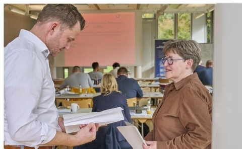
22.10.2025 DSIV Silo-Tag in Karlsruhe