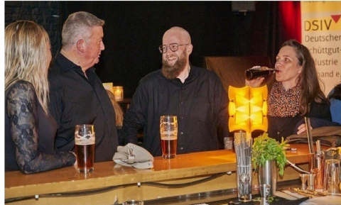
22.09.2025 Kick-Off POWTECH TECHNOPHARM