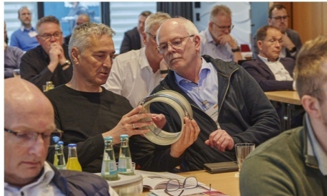
26.03.2025 DSIV Tag der pneumatischen Fördertechnik in Hamburg