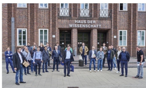
15.05.2025 Technologietag: Digitalisierung & Simulation in Braunschweig