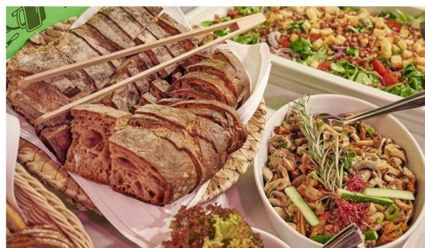
09.04.2025 DSIV Treffen auf der BAUMA in München