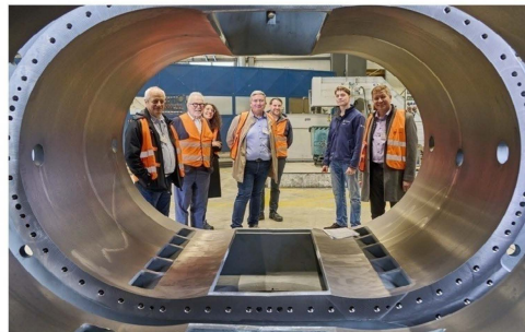
15.10.2025 Besuch der Aerzener Maschinenfabrik