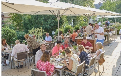
15.08.2025 DSIV Sommerfest in Wiesbaden