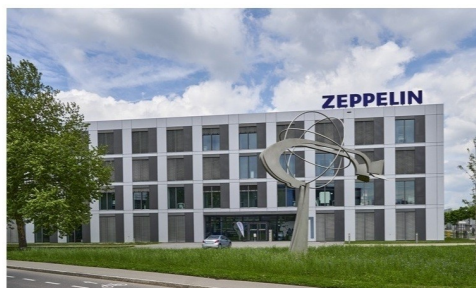
08.05.2025 DSIV besucht Zeppelin Systems GmbH in Friedrichshafen