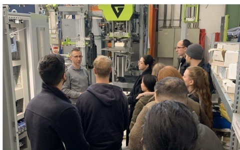
07.11.2025 Young Professionals Exkursion zu Greif-Velox