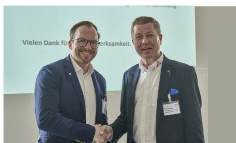
08.05.2025 Mitgliederversammlung in Friedrichshafen