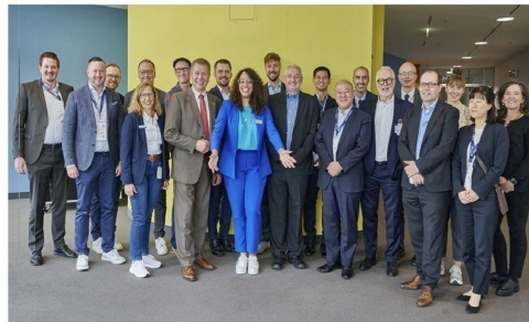
23.09.2025 Treffen internationaler Schüttgutverbände