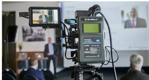
Monatlich Online- Fachstammtisch